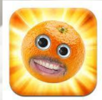
Funny movie maker